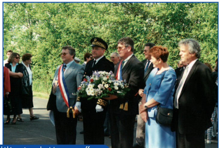
8 Mai 96 - Réception de la délégation de Momerstroff