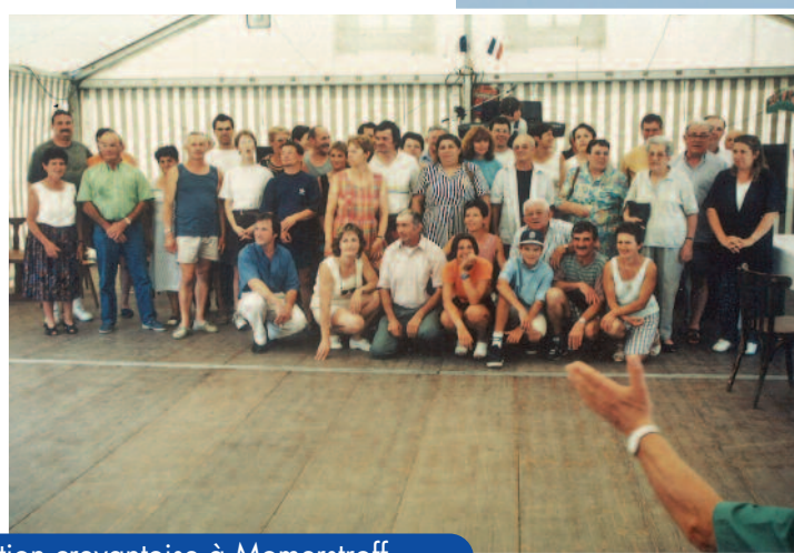
Août 98 - Réception de la délégation crevantoise à Momerstroff