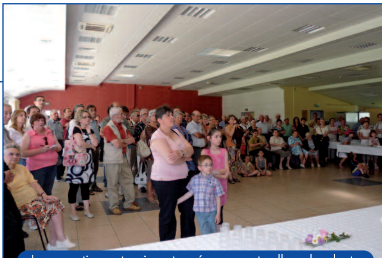
Inauguration extension et aménagement salle polyvalente

Coût : 250 000 € dont 50% de subventions